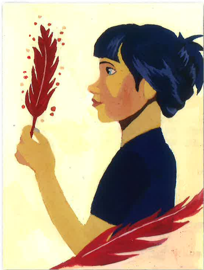
令和7年度 最優秀作品