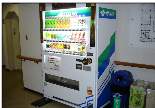
「長崎県総合福祉センター」（長崎市）

赤い羽根支援自動販売機を設置すると販売手数料として 売上の10%～20% が、販売業者から設置者へ支払われます。併せて、売上の一部が、販売業者等から、設置した市町の共同募金会に寄付されます。