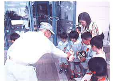
【募金活動を行う子どもたち】