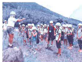
【チャレンジボランティア】