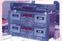
視覚障害者のための 音訳テープ作成