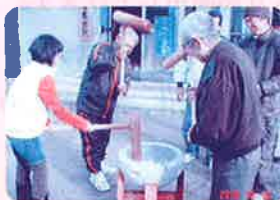
高齢者等への福祉支援 「餅つき大会」