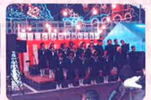
地域活性化 「光の集い」